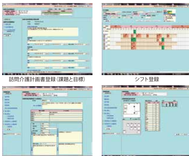
訪問介護計画書登録(課題と目標) シフト登録 利用者情報(利用者別サービス確認票) 利用者情報(住居の見取り図)