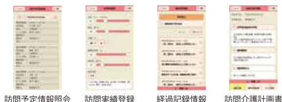
訪問予定情報照会 訪問実績登録 経過記録情報 訪問介護計画書