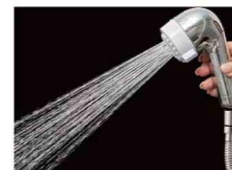
【ミストモード】 Mist Mode