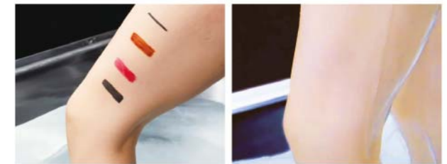
入浴前 [Before] ▶▶ 入浴10分後 [10 min. later]