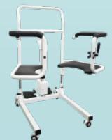
専用電動シャワー椅子(別売)