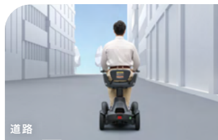
右側を通行する 歩道がない道路や路側帯を通行する場合