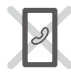
携帯電話などの ながら運転はしない