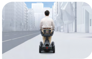
歩道を通行する 車道と歩道の区別がある道路を通行する場合