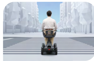
横断歩道を通行する 道路を横断する場合 ※信号機のある交差点では、歩行者用信号に従って通行してください。