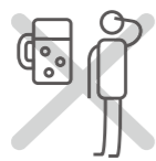
飲酒後や体調不良時の 運転はしない