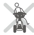
発進時から走行中、 停車までは、足や身体を 車体から乗り出さない