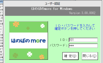
▲システム起動時画面

個別支援計画システム、計画相談支援（計画書）システムの計画書／モニタリングはお客様独自の様式にイメージを合わせることが可能です。また、複写等の機能で作成時間の削減をサポートします。