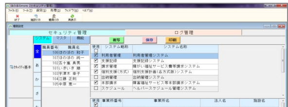
▲セキュリティ設定画面