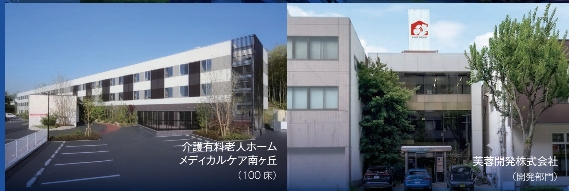
介護有料老人ホーム メディカルケア南ヶ丘 (100 床)