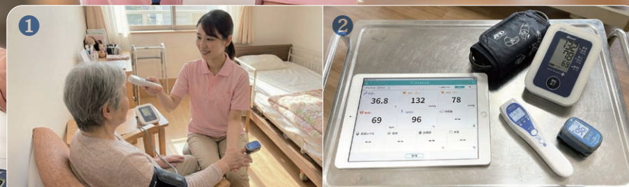
1 バイタルを測定します