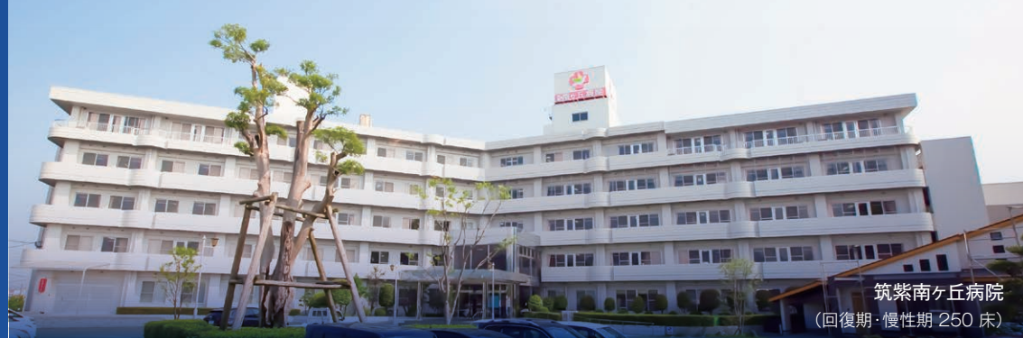
筑紫南ヶ丘病院 (回復期・慢性期 250 床)