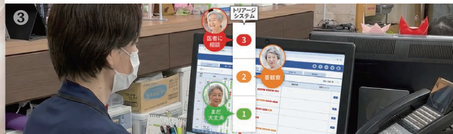
3 クラウドに蓄積されたデータからAIが分析しリスク順に並べてくれます