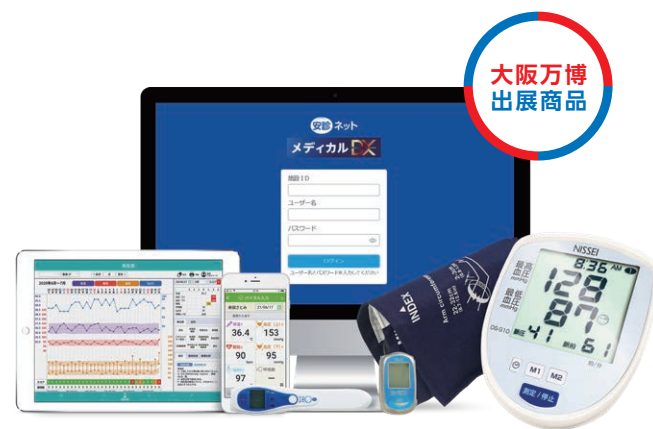
芙蓉開発株式会社 (開発部門)