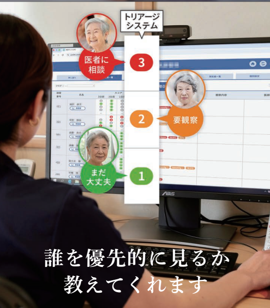
誰を優先的に見るか 教えてください