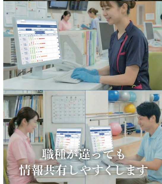
職種が違って 情報共有しやすくします