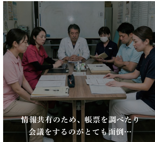
情報共有のため、帳票を調べたり 会議をするのがとても面倒…