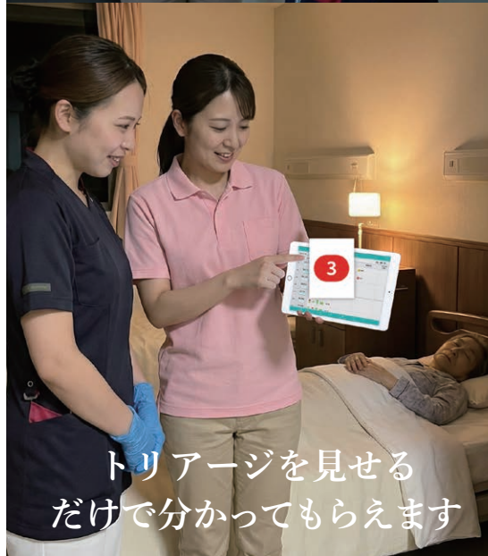
トリアージを見せる だけで分かってもらえます