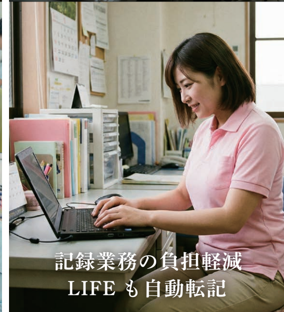
記録業務の負担軽減 LIFE も自動転記