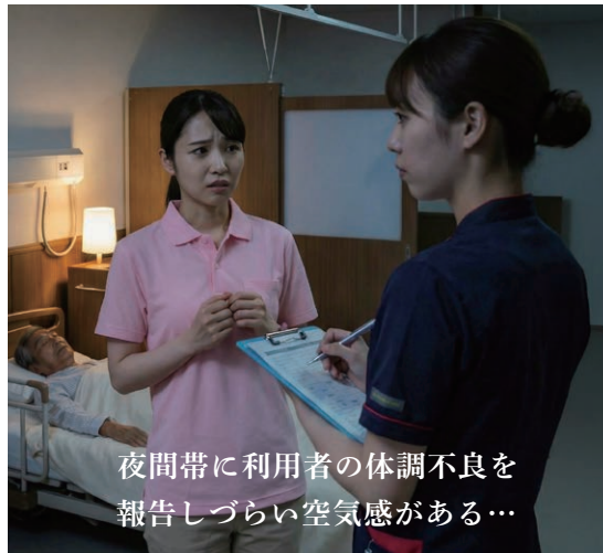
夜間帯に利用者の体調不良を 報告しづらい空気感がある…