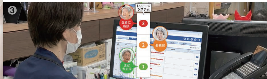
3 クラウドに蓄積されたデータからAIが分析しリスク順に並べてくれます