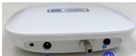
ナースコール接続ケーブル (樹脂コネクタ)の差込口