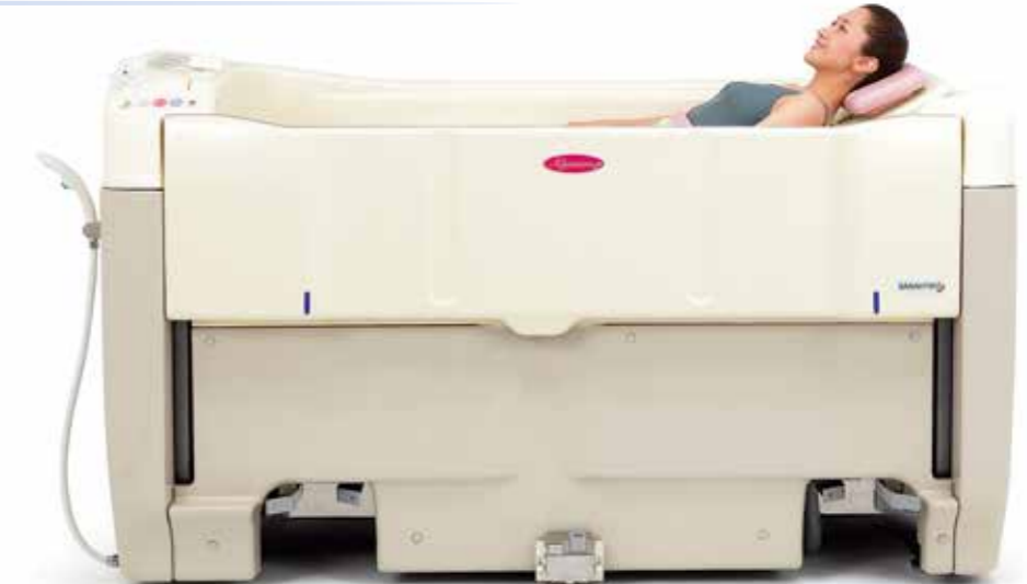
新湯式仰臥位浴槽 アリッサム ALM-700

3m×3mで、らくらくスムーズ。 電動昇降式扉を採用、壁付け設置で3方向エプロンを実現しました。 3m×3mのスペースを有効活用。介助する方、入浴する方双方に大きなゆとりをもたらします。