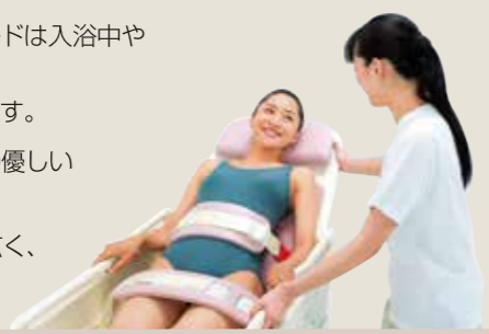
リクライナー(担架) WS-700

リクライナー リクライナーの周囲はどこからでも操作しやすいデザイン。スムーズな操作性を実現します。また安心の大型サイドフェンスやフットガードは入浴中や移動時の不安を軽減するとともに、サイドフェンスは手すりとしても活用できます。 ● 肌の触れる部分には弾力があり、肌触りの優しい熱圧成型マットを採用しています。 ● 高さ調節式ヘッドレストは幅が40cmと広く、どこに頭を乗せても安心です。