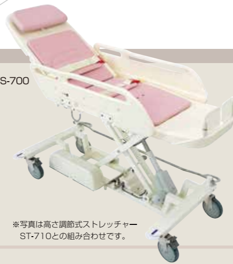
※写真は高さ調節式ストレッチャー ST-710との組み合わせです。

ストレッチャー 移乗の負担を軽減するために高さ調節式ストレッチャーを標準装備しました。また駆動部や水受け盤を小さく押さえた設計と直径150mmの大型キャスターを採用したことで操作性が大幅に向上しました。 ● リクライナーの高さは45.5cmまで下降します。 ● キャスターは2輪トータルロック付きです。