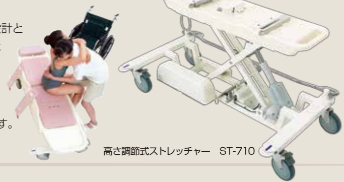
高さ調節式ストレッチャー ST-710

ストレッチャー 移乗の負担を軽減するために高さ調節式ストレッチャーを標準装備しました。また駆動部や水受け盤を小さく押さえた設計と直径150mmの大型キャスターを採用したことで操作性が大幅に向上しました。 ● リクライナーの高さは45.5cmまで下降します。 ● キャスターは2輪トータルロック付きです。