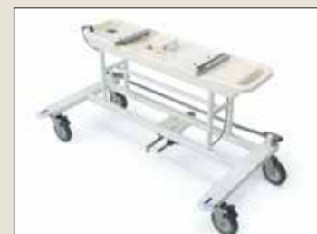
固定式ストレッチャー ST-700