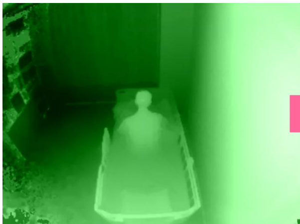
シルエット見守りセンサのシルエット