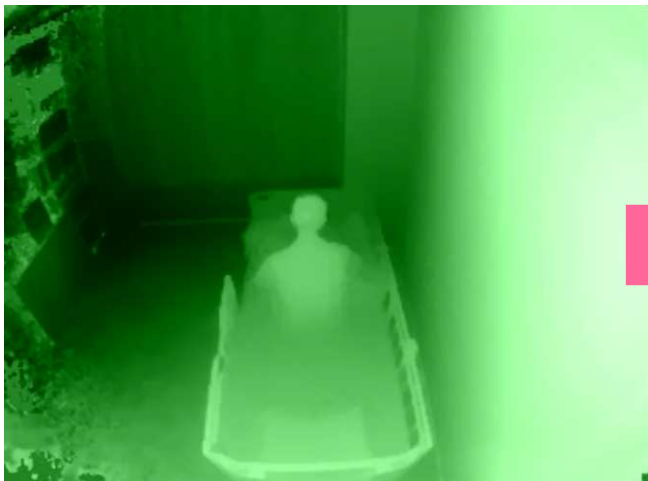
シルエット見守りセンサのシルエット