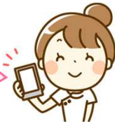
クリア見守りセンサの映像